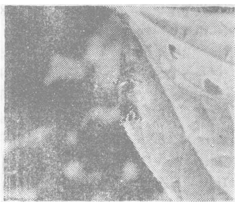
照片2 大豆根瘤山斑蝇