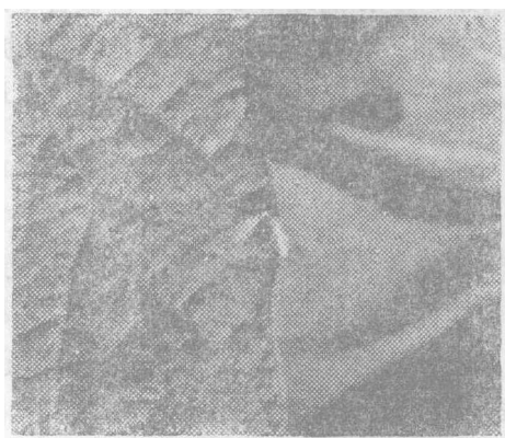
照片1 大豆根瘤圆斑蝇

3. 大豆根瘤端斑蝇。形态特征与圆斑蝇相近似，成虫体长为4.8~7mm，黑色具有兰色和金绿色光泽。胸背有两条淡白色条纹，在后方汇合。翅：在翅顶R 2 ， 3 ， 4 脉端部有一棕色斑(如图 3 )。平衡棒褐色，足及其附节黄色。幼虫：老熟幼虫体长3.6~5.2mm。蛹：红褐色。